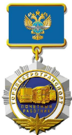
РИСУНОК нагрудного знака «Почетный работник горэлектротранспорта»

На оборотной стороне колодки имеется приспособление для крепления нагрудного знака к одежде.