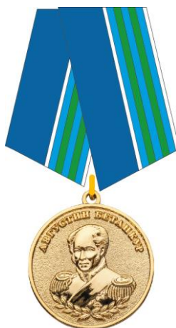
РИСУНОК медали Августина Бетанкура

На оборотной стороне колодки расположено приспособление для крепления медали к одежде.