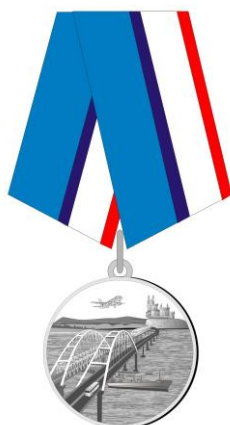
РИСУНОК медали « За развитие транспортной системы Крыма»

На оборотной стороне колодки расположено приспособление для крепления медали к одежде.