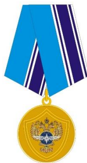
РИСУНОК медали «За заслуги в обеспечении транспортной безопасности»

На оборотной стороне колодки расположено приспособление для крепления медали к одежде.