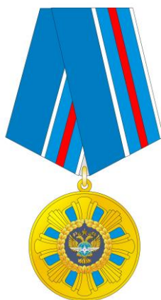
РИСУНОК медали «За взаимодействие»

На оборотной стороне колодки расположено приспособление для крепления медали к одежде.