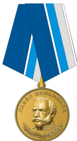
РИСУНОК медали Павла Мельникова

На оборотной стороне колодки расположено приспособление для крепления медали к одежде.