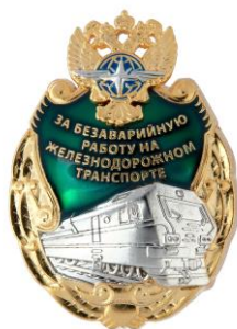
РИСУНОК нагрудного знака отличия «За безаварийную работу на железнодорожном транспорте»

На оборотной стороне знака отличия имеется приспособление для крепления к одежде.