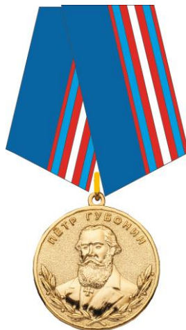
РИСУНОК медали Петра Губонина

На оборотной стороне колодки расположено приспособление для крепления медали к одежде.