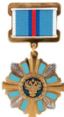
РИСУНОК знака отличия Министра транспорта Российской Федерации «За труд и пользу»

На оборотной стороне колодки расположено приспособление для крепления знака отличия к одежде.