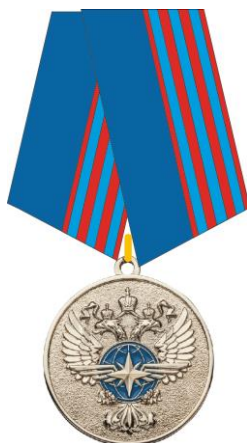
РИСУНОК медали «За безупречный труд и отличие» III степени