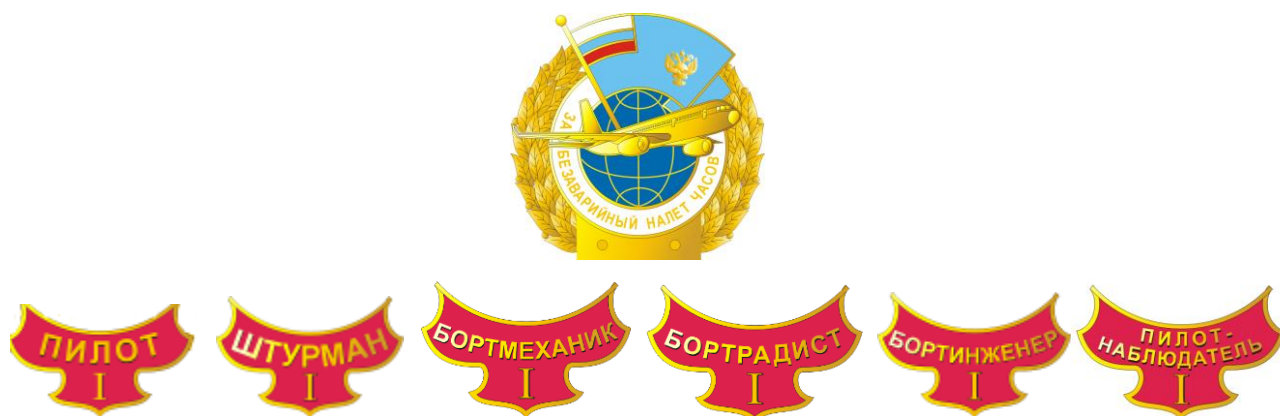
РИСУНОК нагрудного знака отличия «За безаварийный налет часов» I степени

На оборотной стороне знака отличия имеется приспособление для крепления к одежде.