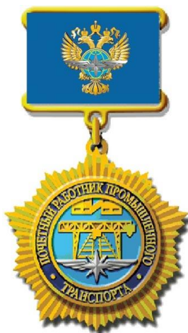
РИСУНОК нагрудного знака «Почетный работник промышленного транспорта»

На оборотной стороне колодки имеется приспособление для крепления нагрудного знака к одежде.