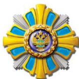
РИСУНОК миниатюры знака отличия Министра транспорта Российской Федерации «За труд и пользу»

На оборотной стороне миниатюры знака отличия расположено приспособление для крепления к одежде.