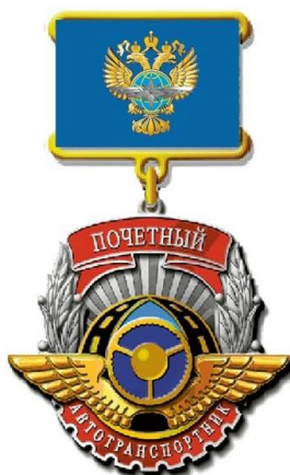
РИСУНОК нагрудного знака «Почетный автотранспортник»

На оборотной стороне колодки имеется приспособление для крепления нагрудного знака к одежде.