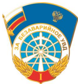
РИСУНОК нагрудного знака отличия «За безаварийное УВД» I степени

На оборотной стороне знака отличия имеется приспособление для крепления к одежде.