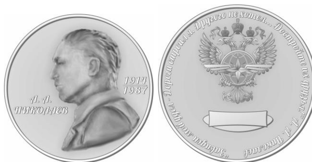
РИСУНОК медали А.А. Николаева