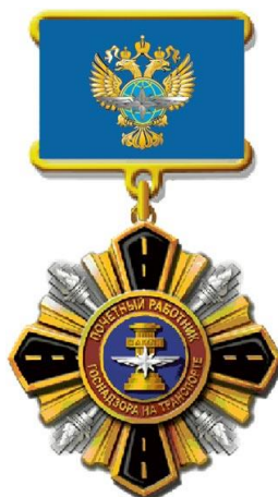
РИСУНОК нагрудного знака «Почетный работник госнадзора на транспорте»

На оборотной стороне колодки имеется приспособление для крепления нагрудного знака к одежде.