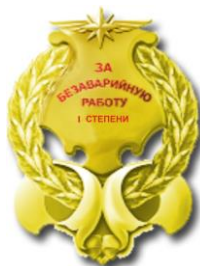
РИСУНОК нагрудного знака отличия «За безаварийную работу» I степени

На оборотной стороне нагрудного знака отличия имеется приспособление для крепления к одежде.