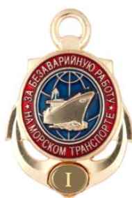
РИСУНОК нагрудного знака отличия «За безаварийную работу на морском транспорте» I степени

Нагрудный знак отличия крепится к одежде при помощи винта с гайкой.