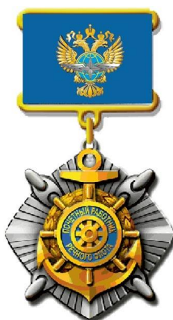
РИСУНОК нагрудного знака «Почетный работник речного флота»

На оборотной стороне колодки имеется приспособление для крепления нагрудного знака к одежде.