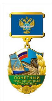
РИСУНОК нагрудного знака «Почетный транспортный строитель»

На оборотной стороне колодки имеется приспособление для крепления нагрудного знака к одежде.