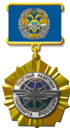
РИСУНОК нагрудного знака «Почетный работник транспорта России»

На оборотной стороне колодки имеется приспособление для крепления нагрудного знака к одежде.