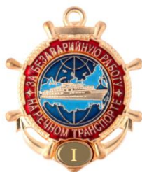
РИСУНОК нагрудного знака отличия «За безаварийную работу на речном транспорте» I степени

Нагрудный знак отличия крепится к одежде при помощи винта с гайкой.