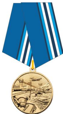
РИСУНОК медали «За строительство транспортных объектов»

Медаль при помощи ушка и кольца соединяется с пятиугольной колодкой, обтянутой муаровой лентой шириной 24 мм наполовину голубой, наполовину светло-синей, окаймленной синими полосками шириной 1 мм каждая. По центру светло-синей части ленты расположены две полосы белого цвета шириной 1,5 мм каждая, разделенные синей полосой шириной 1,5 мм. На оборотной стороне колодки расположено приспособление для крепления медали к одежде.