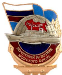
РИСУНОК нагрудного знака «Почетный работник морского флота»

На оборотной стороне знака имеется приспособление для крепления нагрудного знака к одежде.