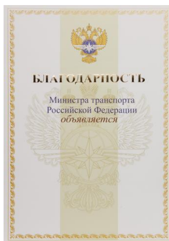
РИСУНОК Благодарности Министра транспорта Российской Федерации

Под словом «БЛАГОДАРНОСТЬ» на расстоянии 20 мм на фоновом изображении большой эмблемы Министерства транспорта Российской Федерации располагаются слова синего цвета в две строки, расстояние между которыми 7 мм «Министра транспорта Российской Федерации». На 5 мм ниже расположено слово «объявляется».