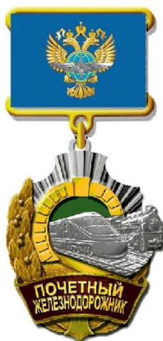
РИСУНОК нагрудного знака «Почетный железнодорожник»

На оборотной стороне колодки имеется приспособление для крепления нагрудного знака к одежде.