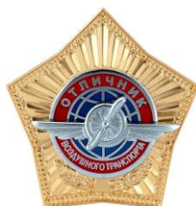
РИСУНОК нагрудного знака «Отличник воздушного транспорта»

На оборотной стороне нагрудного знака имеется приспособление для крепления к одежде.