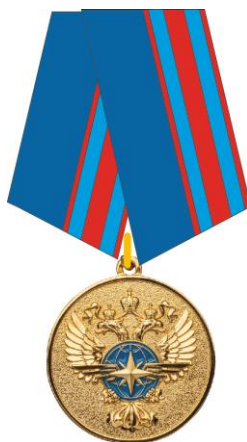
РИСУНОК медали «За безупречный труд и отличие» II степени