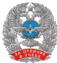
РИСУНОК знака «За отличие в учебе»

На оборотной стороне знака имеется приспособление для крепления к одежде.