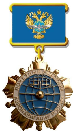
РИСУНОК нагрудного знака «Почетный работник авионавигации России»

На оборотной стороне колодки нагрудного знака располагается приспособление для крепления к одежде.