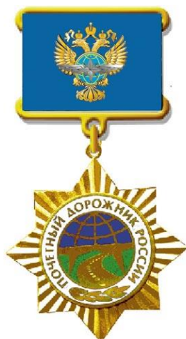
РИСУНОК нагрудного знака «Почетный дорожник России»

На оборотной стороне колодки имеется приспособление для крепления нагрудного знака к одежде.